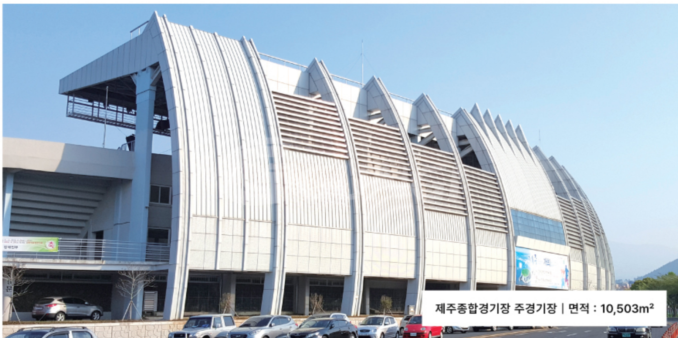
제주종합경기장 주경기장 | 면적 : 10,503m 2