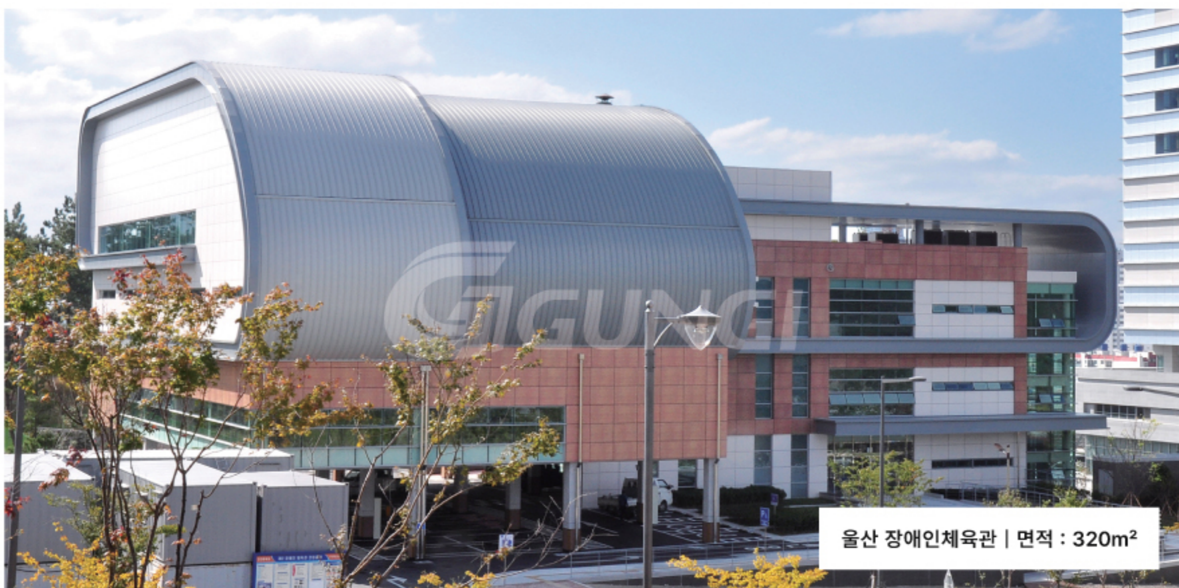
울산 장애인체육관 | 면적 : 320m 2