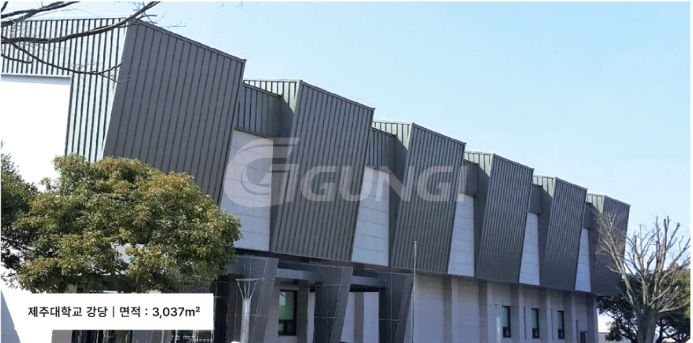
제주대학교 강당 | 면적 : 3,037m 2