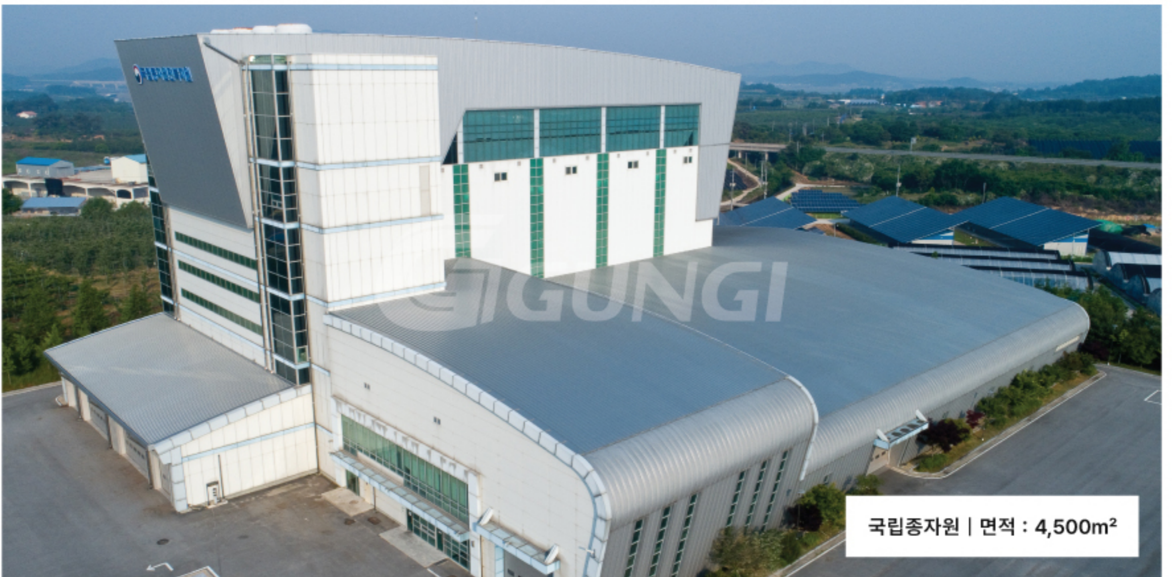
국립종자원 | 면적 : 4,500m 2