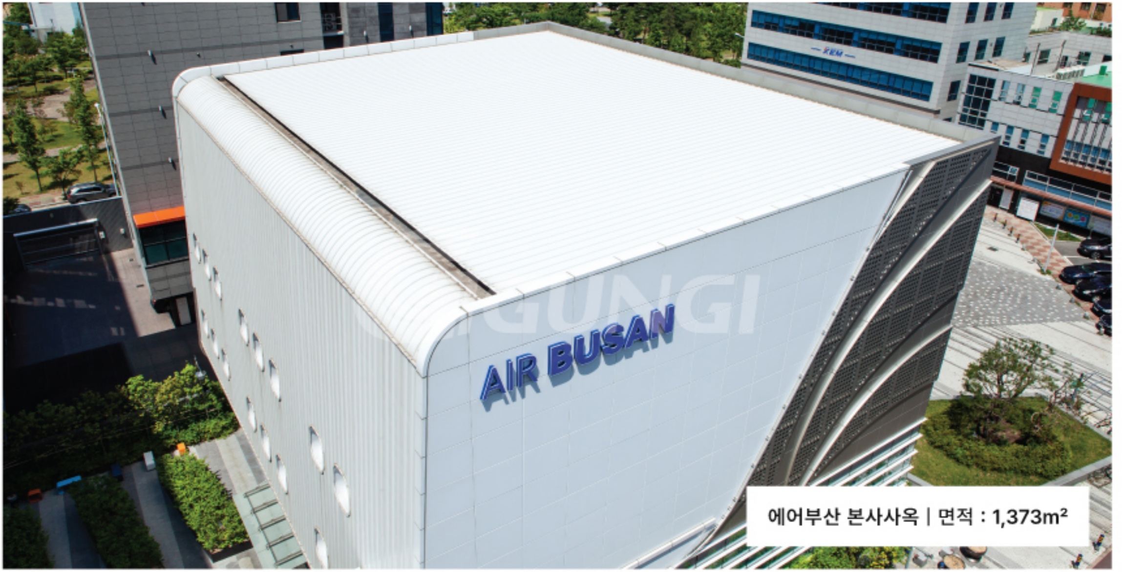
에어부산 본사사옥 | 면적 : 1,373m 2