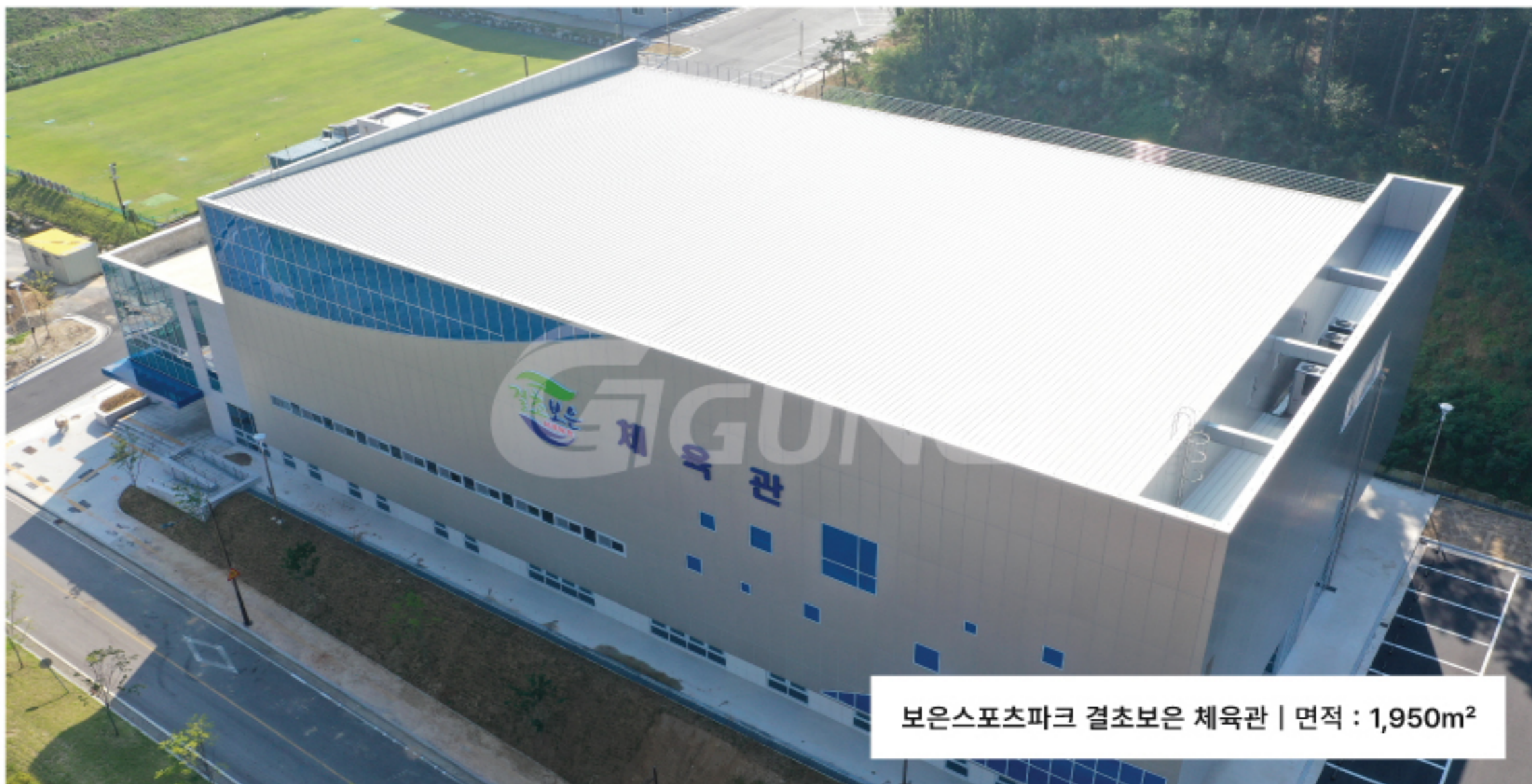
보은스포츠파크 결초보은 체육관 | 면적 : 1,950m 2