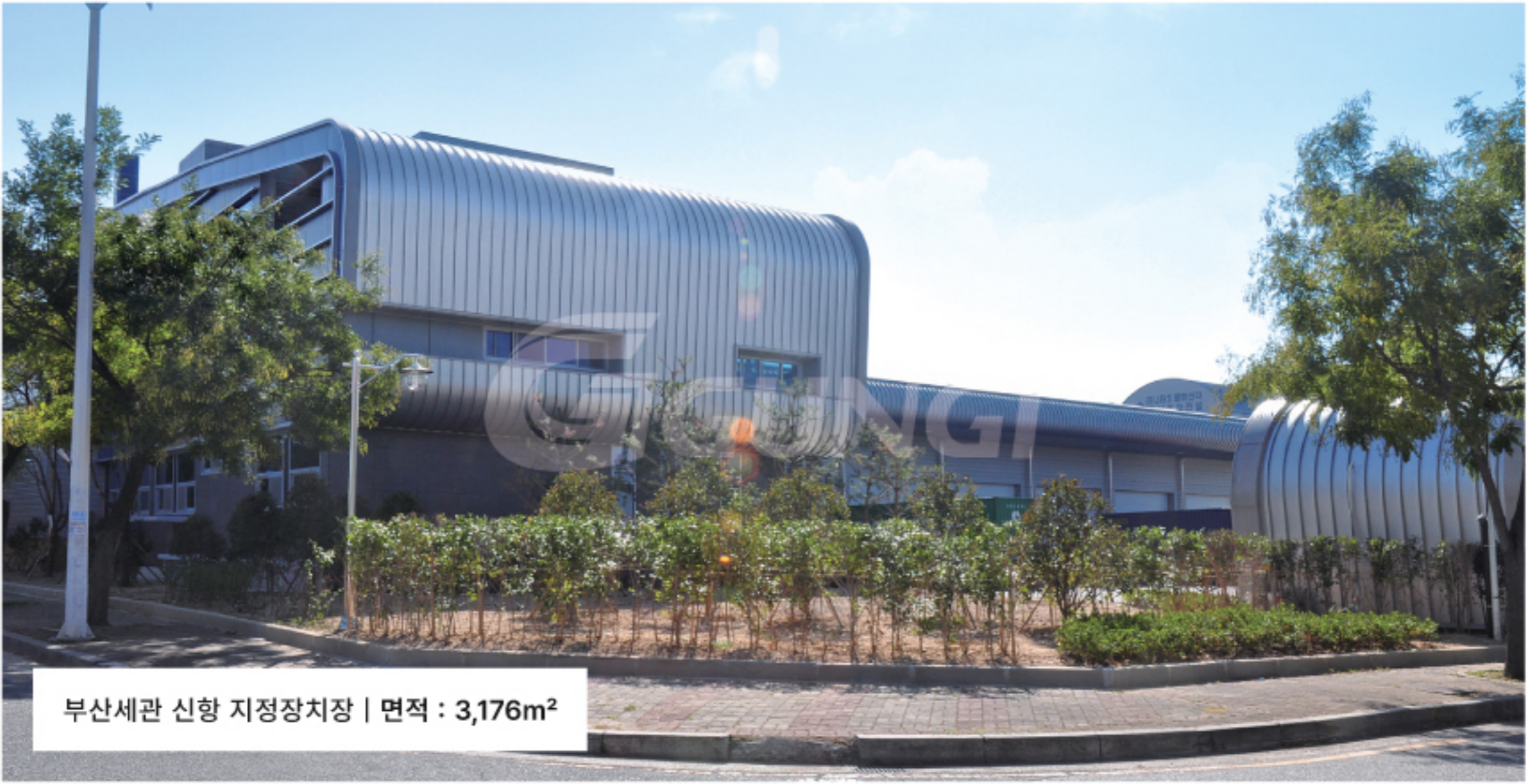
부산세관 신항 지정장치장 | 면적 : 3,176m 2