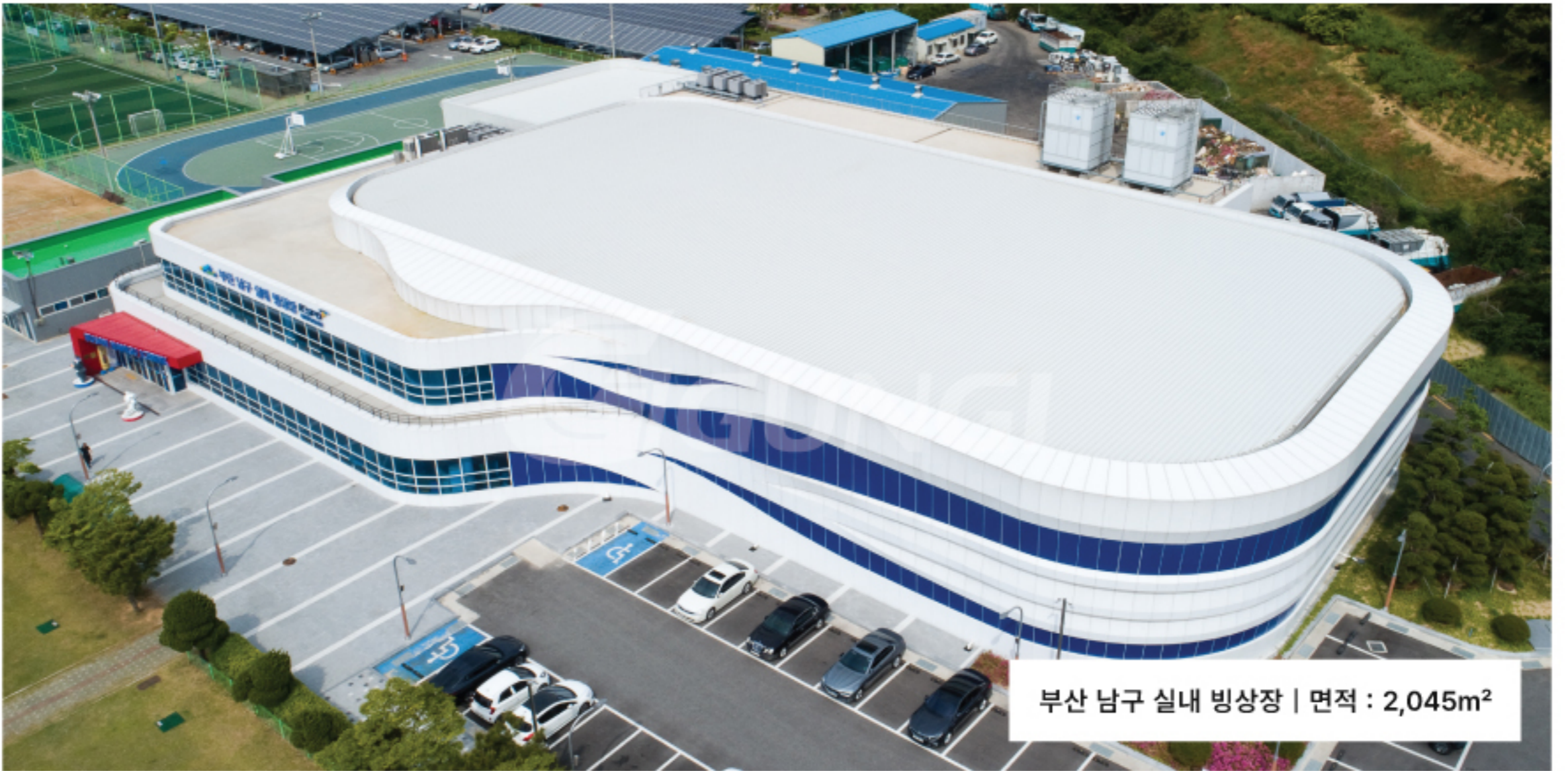
부산 남구 실내빙상장 | 면적 : 2,045m 2